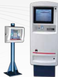
Gestión informática de los pesajes con o sin terminal(es)